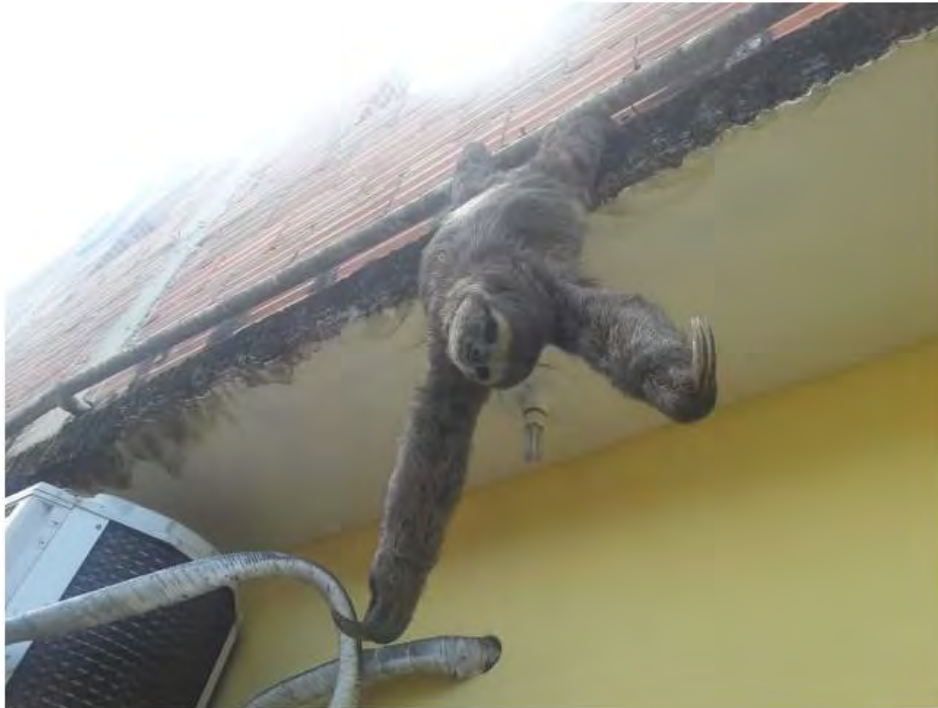
O animal foi devolvido ao seu habitat natural

Uma arara-azul-e-amarela também foi encontrada no mesmo bairro