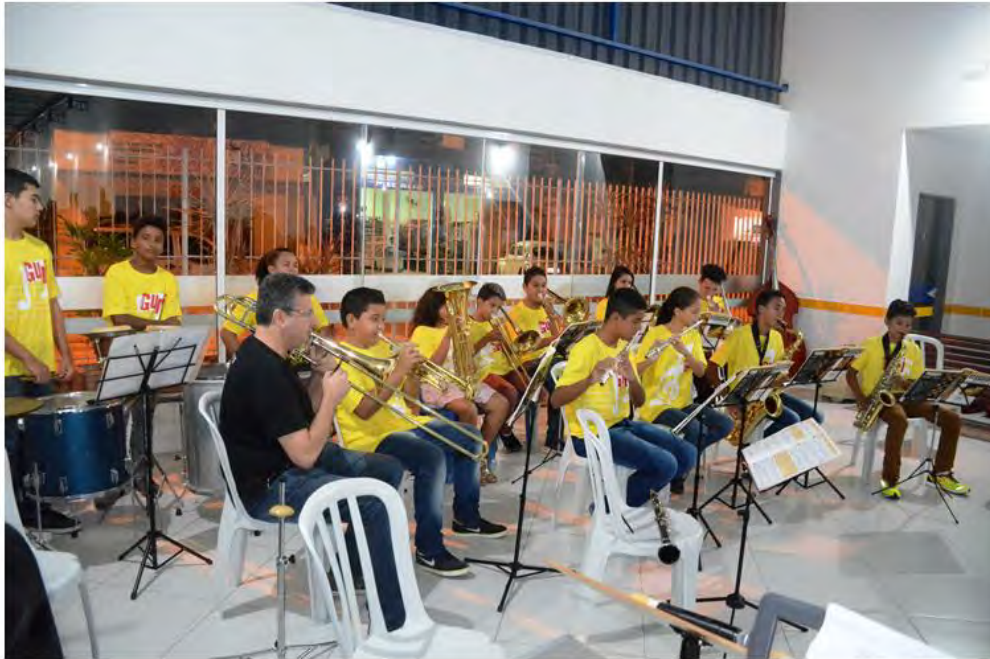
#PraCegoVer - Alunos acompanhados por professor, vestem camisetas amarelas do Projeto Guri durante ensaio com instrumentos de sopro.

O Polo do Projeto Guri de Caraguatatuba está com matrículas abertas até 28 de fevereiro para jovens de 8 a 18 anos que queiram aprender a tocar instrumentos musicais ou cantar.