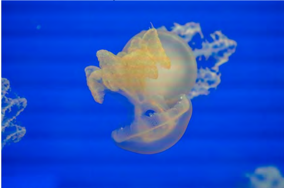
Flagra. Água-viva registrada pelo Instituto Argonauta, no Litoral Norte