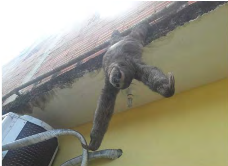
Animal estava próximo ao telhado e corria risco de queda.