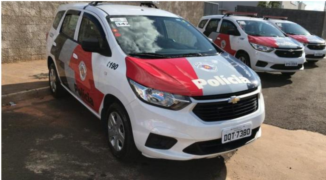
PM foi atender a ocorrência e teria sido atacada

Crime foi registrado na madrugada deste sábado no Tinga, em Caraguatatuba