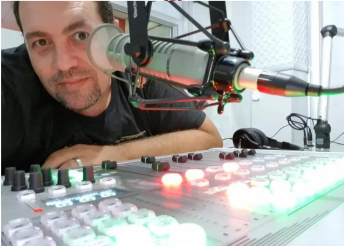
Barcelar, Oceânica será uma emissora multiplataforma

“A emissora ainda está operando em caráter experimental, só executando música. É uma fase de teste. Quando for inaugurada terá jornalismo, prestação de serviços e programa musicais. Vamos operar 24 horas, sempre priorizando o jornalismo”, comentou Barcelar.