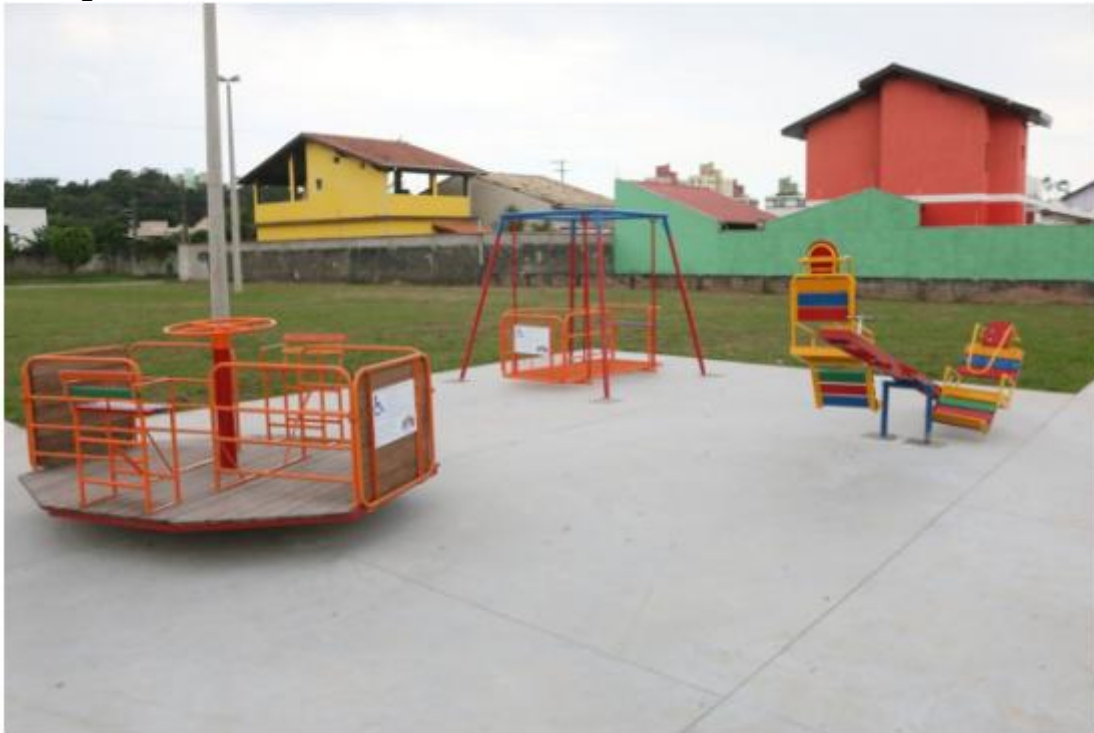
Praça do Idoso conta com playground, bicicletário, mesa de jogos e aparelhos de ginástica

Praça será palco de eventos da comunidade; Ecoponto é o 3º da cidade e o 1º da Região Norte