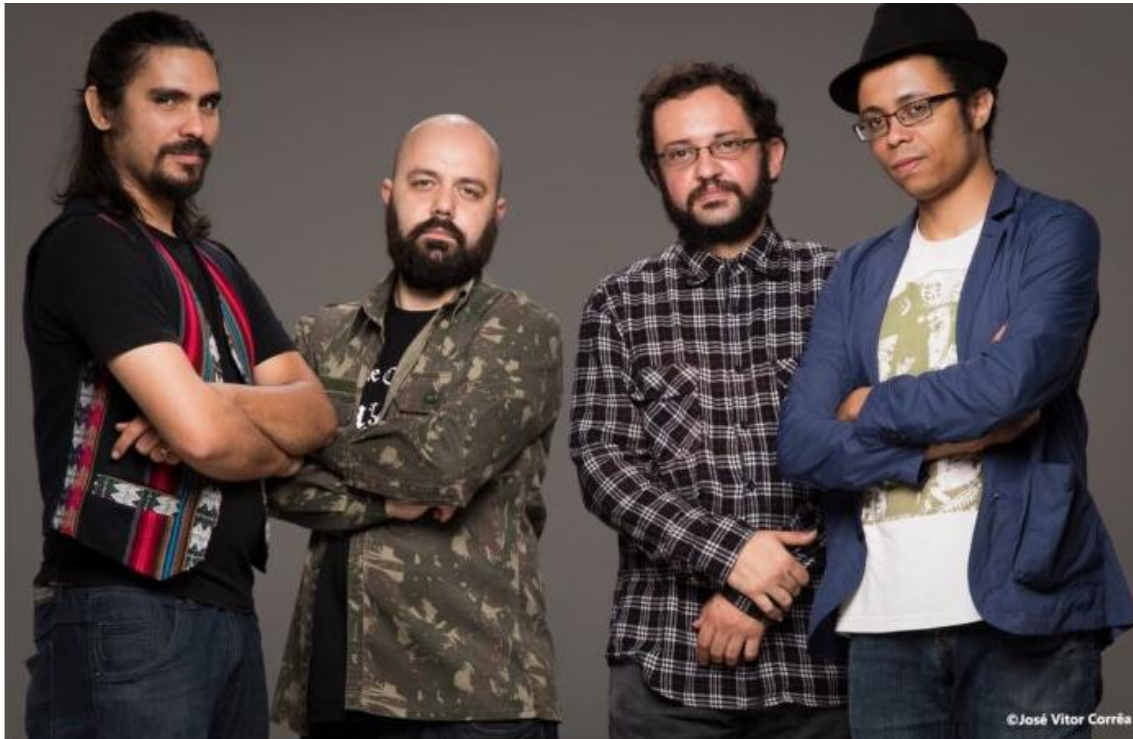
A banda Monte Castelo presta homenagem ao Legião Urbana

Espetáculo musical promete uma viagem de volta aos anos 80 e 90