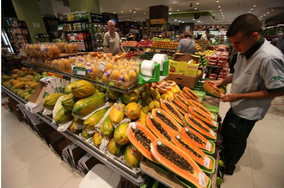
Cebola, cenoura e mamão ficaram mais baratos