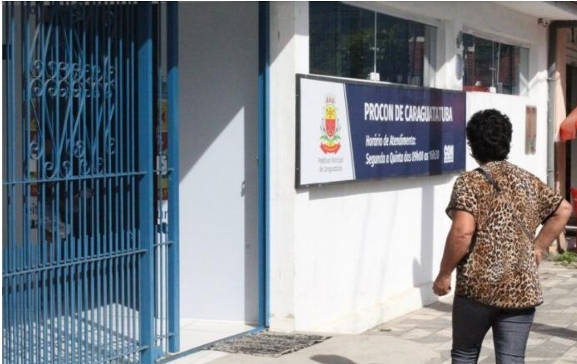
População pode procurar a unidade em horário comercial

Relatório das atividades computou um total de 833 procedimentos formalizados em outubro