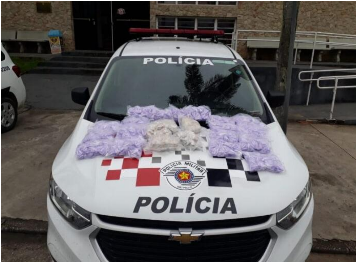
Drogas estavam dentro de duas mochilas com o menor

Ele estava dentro de um ônibus quando a PM fez abordagem