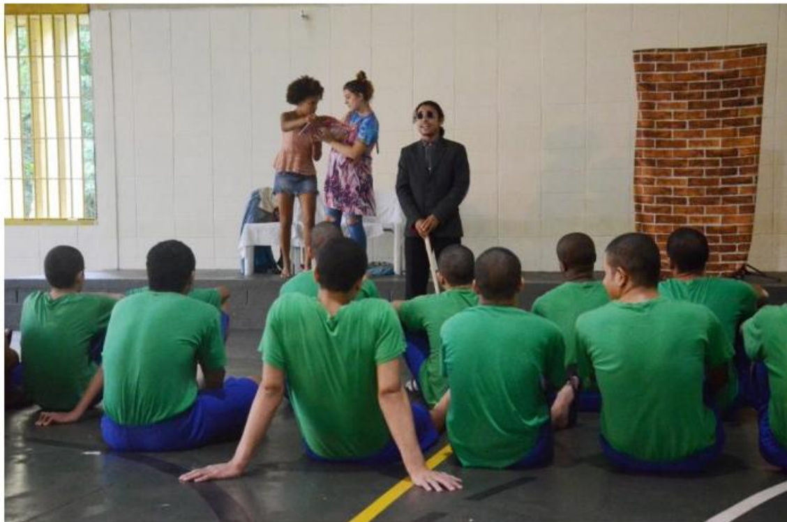
Foram duas apresentações para os 64 internos da unidade

No fim da apresentação os internos distribuíram flores de papel confeccionadas por eles como agradecimento