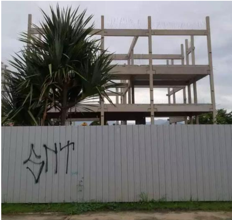
Uso de pré-moldados agilizará a obra do Fórum

Em outubro de 2018, uma nova empresa, a Construtora JHD Construções e Comércio Ltda, foi contratada para retomar as obras, avaliadas em R$ 14,7 milhões.