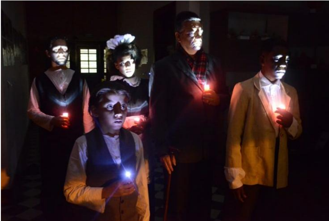
Atores da peça 'Noites no Museu' seguram velas iluminando seus rostos no escuro.

O Teatro Mario Covas (TMC), o Museu de Arte Cultura de Caraguatatuba (MACC) e a Praça Dr. Cândido Mota recebem de 1º a 26 de maio parte da programação do FELINO – Festival de Artes do Litoral Norte. Dois grupos da cidade também se apresentam na região.