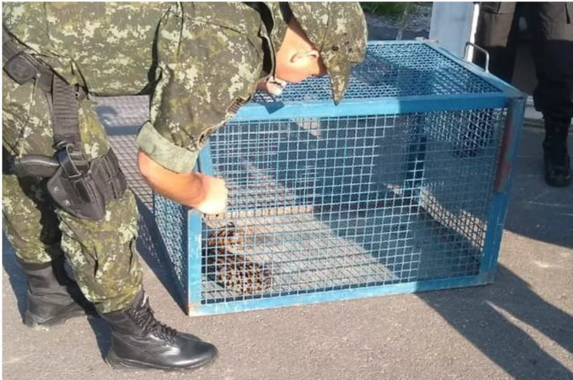
Policiais resgatam gato-dó-mato em Caraguá — Foto: Divulgação/ Polícia Ambiental

Ele foi levado para a Fundação Animalia, em São Sebastião, onde foi constatado que o animal está debilitado. Ele ficará em observação e, após melhora, será devolvido à natureza.