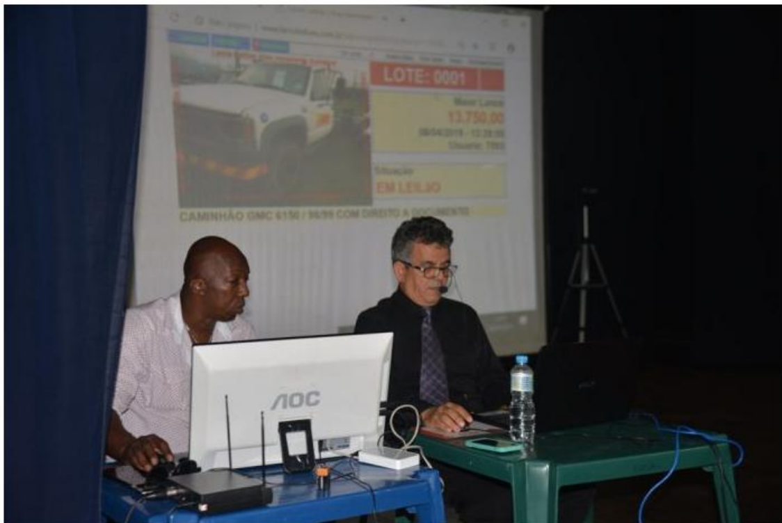
Leilão aconteceu no dia 8 de abril

O valor deve ser destinado à área social do município