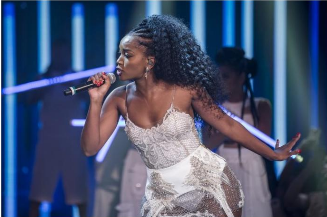
A apresentação da cantora Iza encerra a programação dia 21 de abril

Cantor Leo Pain abre a programação nesta sexta-feira (12)