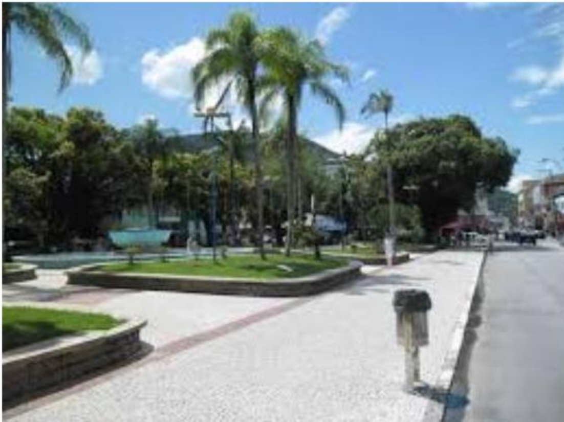
Alterações acontecem próximo a Praça Dr, Cândido Mota

As alterações acontecem nesta segunda-feira (8) para substituição do poço de visita próximo a Praça Cândido Mota