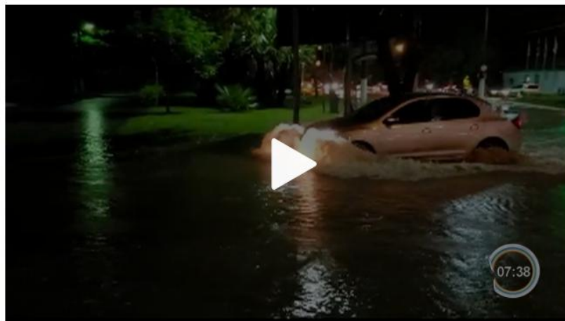
Chuva continuou na noite de segunda e causou mais estragos no litoral

12/03/2019 10h01 · Atualizado há 23 horas