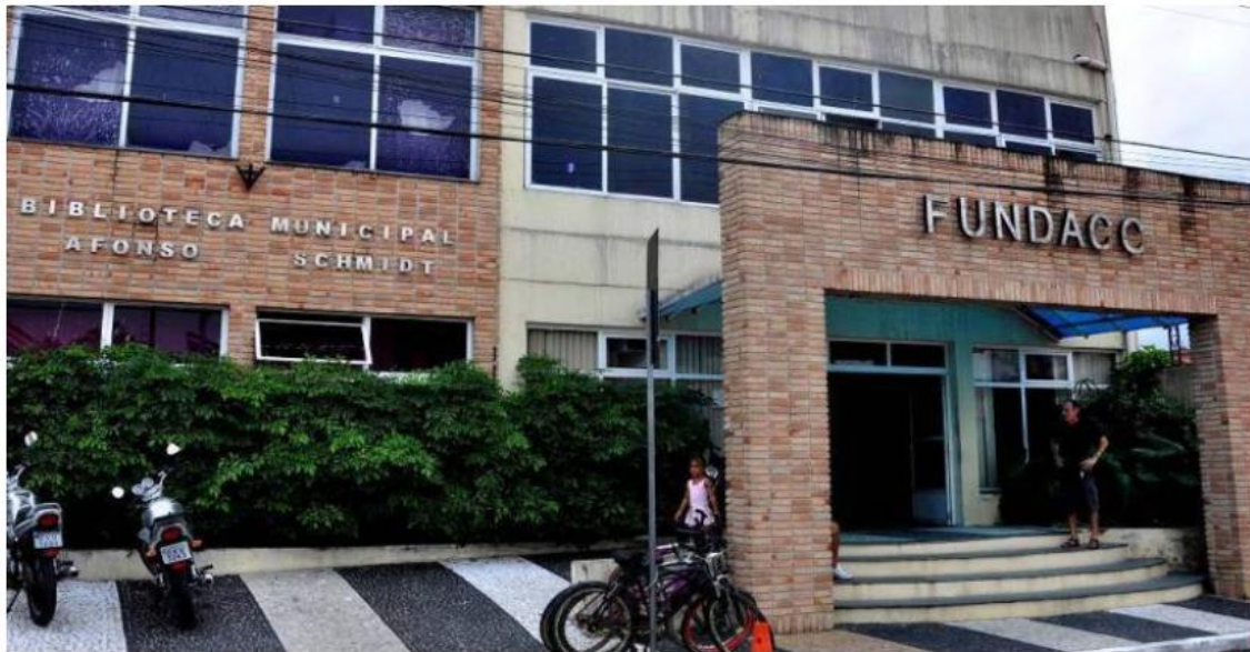
Fundacc (Fundação Educacional e Cultural) de Caraguatatuba