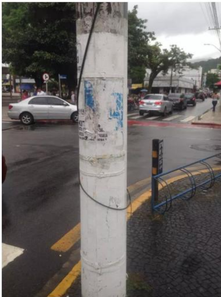
Cabo, possivelmente, de telefone, solto e amarrado em poste na praça Cândido Mota