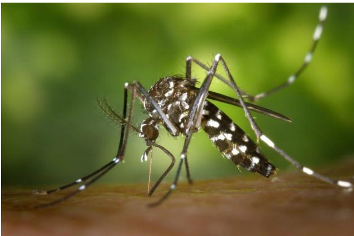
A doença deixou uma vítima fatal em Caraguatatuba

Por Fernanda Velga - 19 de fevereiro de 2019