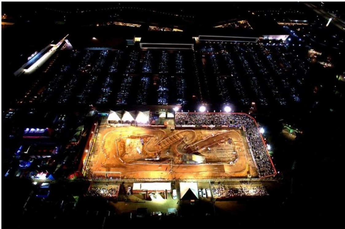
Calendário do Arena Cross Brasil prevê quatro etapas em 2019

Todas rodadas da competição estão programadas no estado de São Paulo