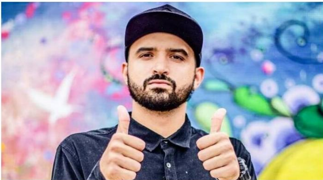
A apresentação acontece no teatro Mario Covas, na terça-feira (19)

Por Redação Nova Imprensa - 18 de fevereiro de 2019