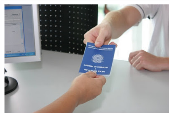
Construção civil também contribuiu para os dados

Alavancada pelas oportunidades de alta temporada, a cidade gerou 1.137 vagas com carteira assinada