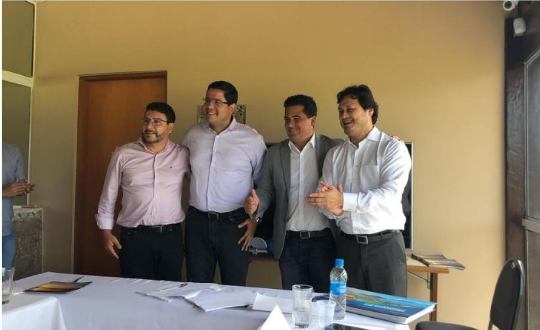
Os prefeitos das quatro cidades que formam o Consórcio

Veículo: Sistema Costa Norte de Comunicação