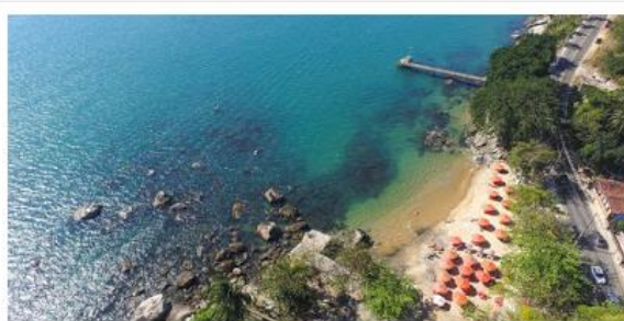
Praia do Portinho, na Ilhabela, está com bandeira vermelha

Agora são 30 pontos impróprios para banho de mar e de rio