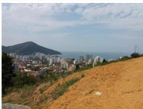
Obra no Morro da Prainha está comprometida

Estado cancelou convênios assinados em 2018 no valor de R$ 13 milhões