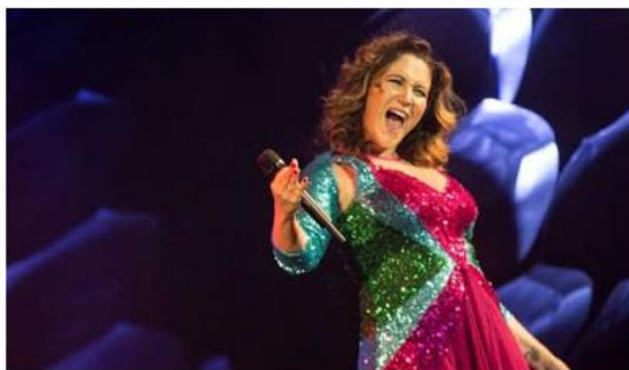
A cantora Maria Rita sobe ao palco no sábado, no Centro

Cidade deve receber 150 mil visitantes para o feriado de São Paulo, nesta sexta-feira (25)