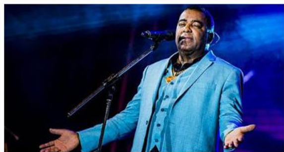
Domingo é a vez da banda Raça Negra no Porto Novo

Para encerrar a programação do fim de semana, a banda Raça Negra traz clássico do pagode para o palco do Porto Novo no domingo (27). A apresentação está marcada para as 20h e tem abertura da banda local Simplicidade SA.