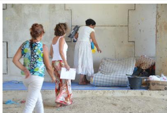
Local foi encontrado após denúncia no Facebook

Cerca de 30 pessoas, incluindo crianças, estavam morando no local