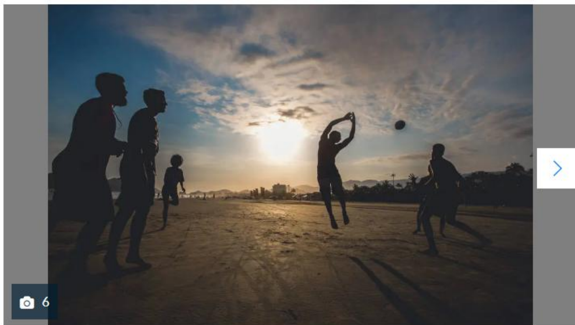
Beach rugby ganha espaço nas praias brasileiras

A mesma situação se reflete no rúgbi, que tem agremiações já tradicionais no litoral, como a Associação Ilhabela Rugby Clube, e também é promovido em eventos privados ou apoiados por prefeituras de municípios como Caraguatatuba e Itanhaém, no litoral sul de São Paulo.