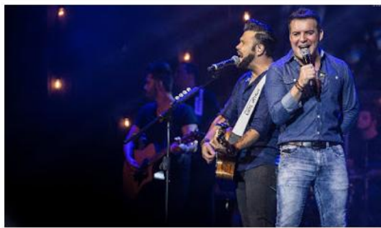
A dupla se apresenta nesta sexta-feira e sábado

Shows de Verão contam ainda com Di Ferrero e Os Filhos dos Caras nas duas cidades