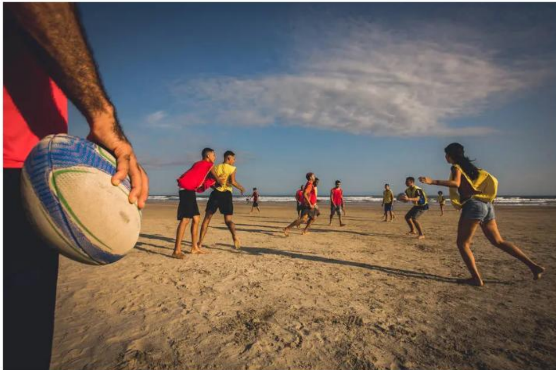
Partida de 'beach rugby' em Bertioga, litoral de São Paulo

Priscila Mengue, O Estado de S.Paulo 20 Janeiro 2019 | 03h00