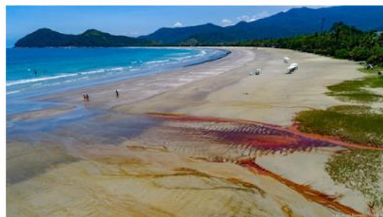
Baleia, na Costa Sul de São Sebastião, está poluídas

São 15 pontos contra 50 divulgados na semana anterior