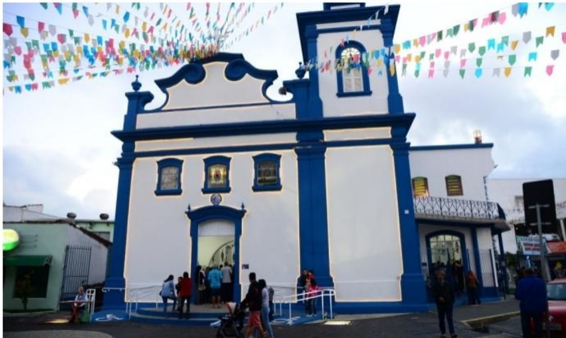
Arquitetura. O farol, em Ubatuba, é uma das atrações procuradas pelos turistas