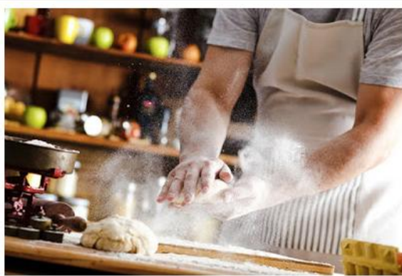
As vagas são limitadas e acontecem via Fundo Social

Os interessados devem comparecer ao Fundo Social até quarta-feira (16)