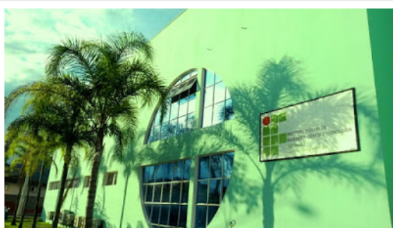
A entidade oferece 16 vagas remanescentes

As aulas são oferecidas pelo Instituto Federal de São Paulo para maiores de 18 anos no período noturno