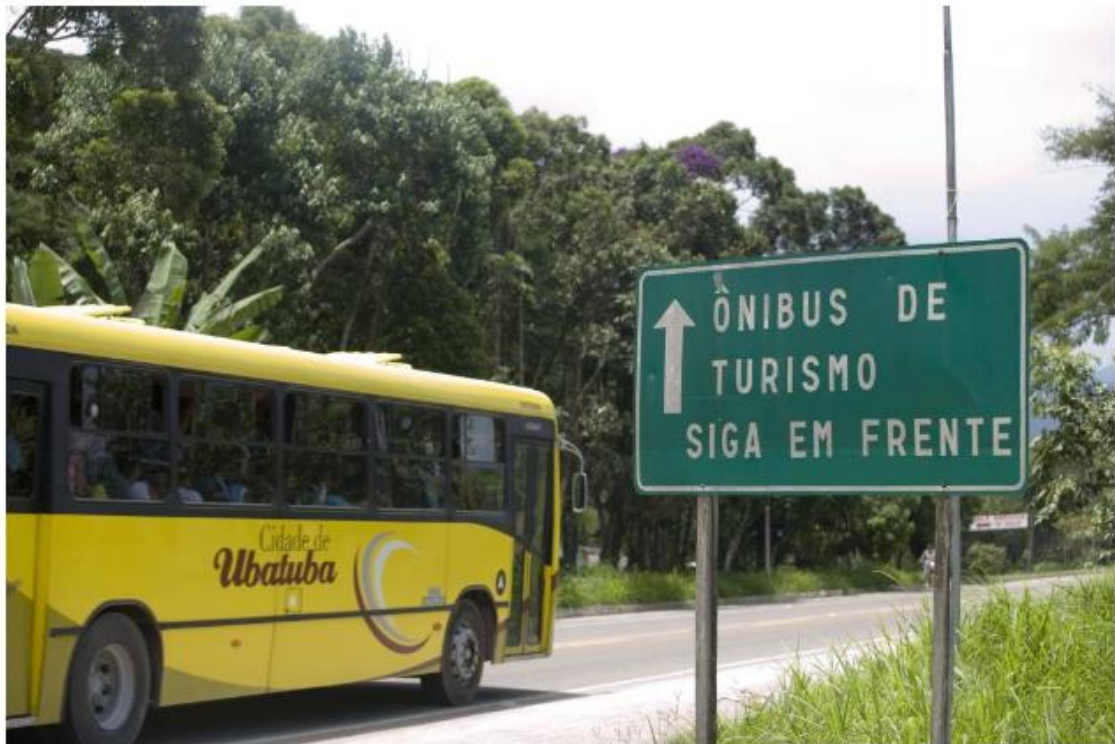
Placa com indicação para ônibus de turismo em Ubatuba, no litoral norte de SP - João Wainer - 26.01.07/Folhapress