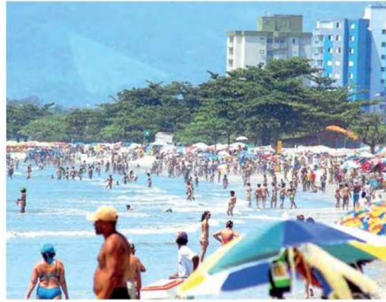
De acordo com a Associação de Hotéis e Pousadas (AHP), a taxa de ocupação chegou a 96%

Ao todo, 10 caminhões estiveram disponíveis e houve um reforço de coleta nos bairros do Porto Novo, Indaiá, Aruan e toda a região Norte (Jetuba, Massaguçu,