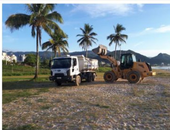
Não chove na região desde a última sexta-feira

Previsão do tempo é que volte a chover ao longo de todo o feriado prolongado