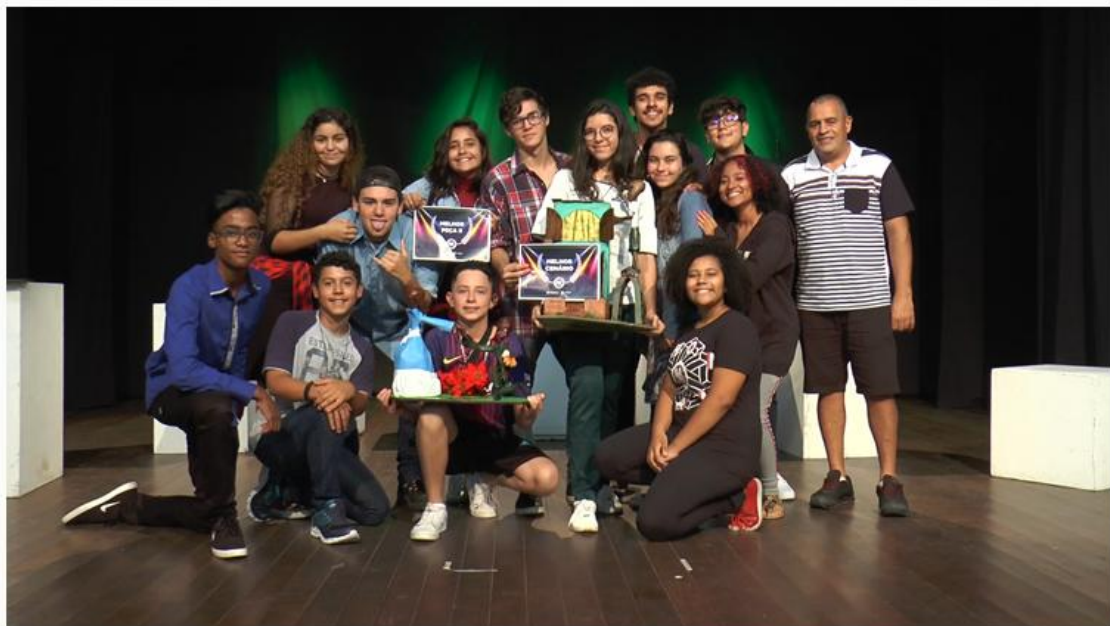
'18 de Agosto', da Cia. Teatral Filosofia de Coxia, de São Paulo, como a melhor peça do festival.

Por: Da Redação, com prefeitura de Caraguatatuba